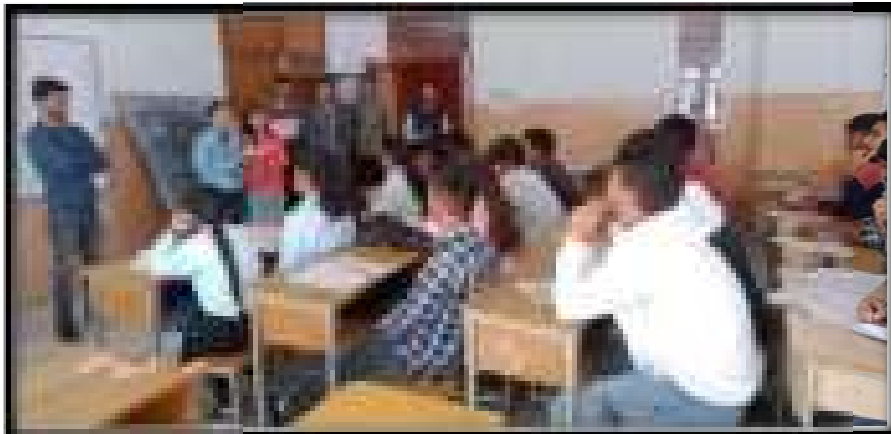
CSCA members are awaking the students towards CGC activities