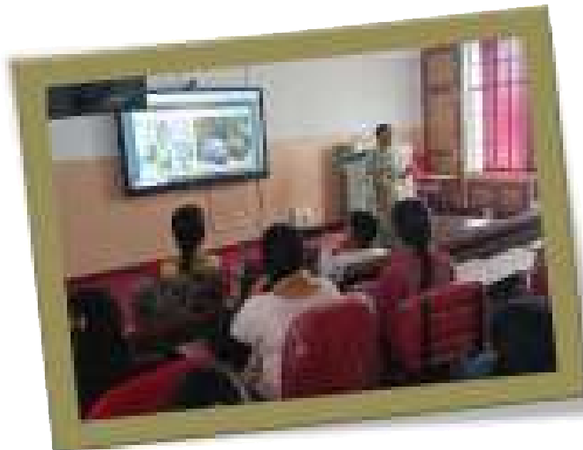
Lecture-cum-job placement drive