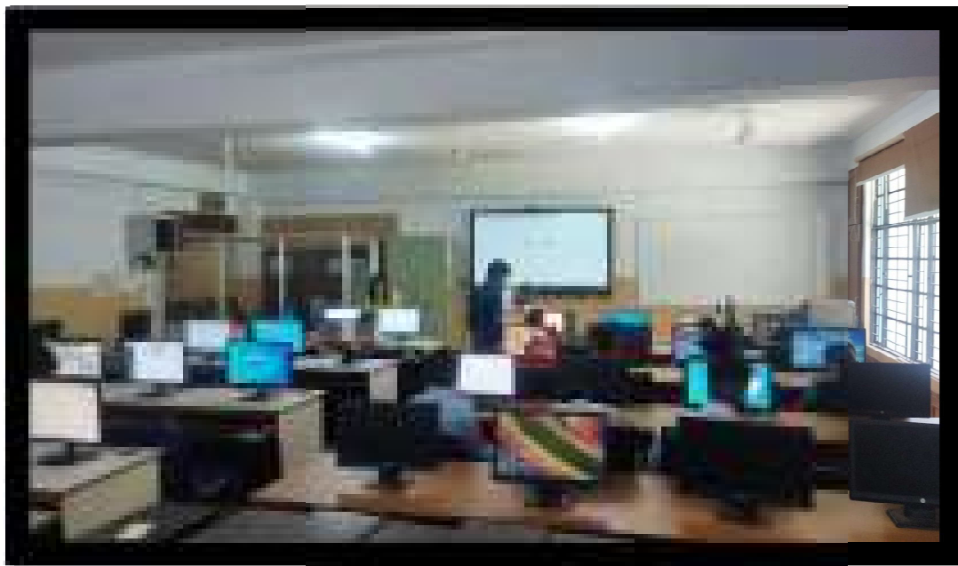
Lecture-cum-job placement drive