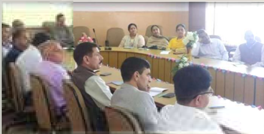
School Principal's meet