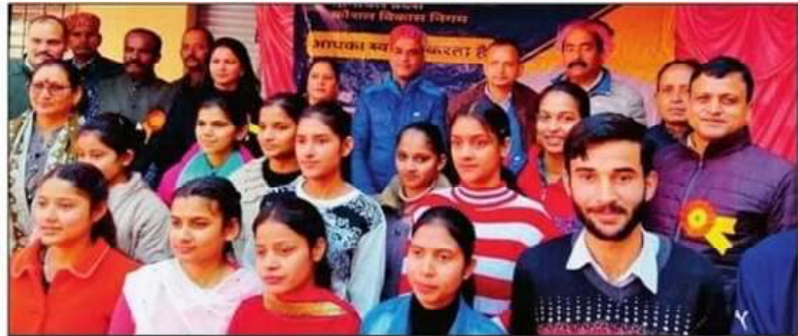
भोरंज में लगे रोजगार मेले में पहुंचे युवा। -संवाद

इस अवसर पर हिमाचल प्रदेश कौशल विकास निगम के