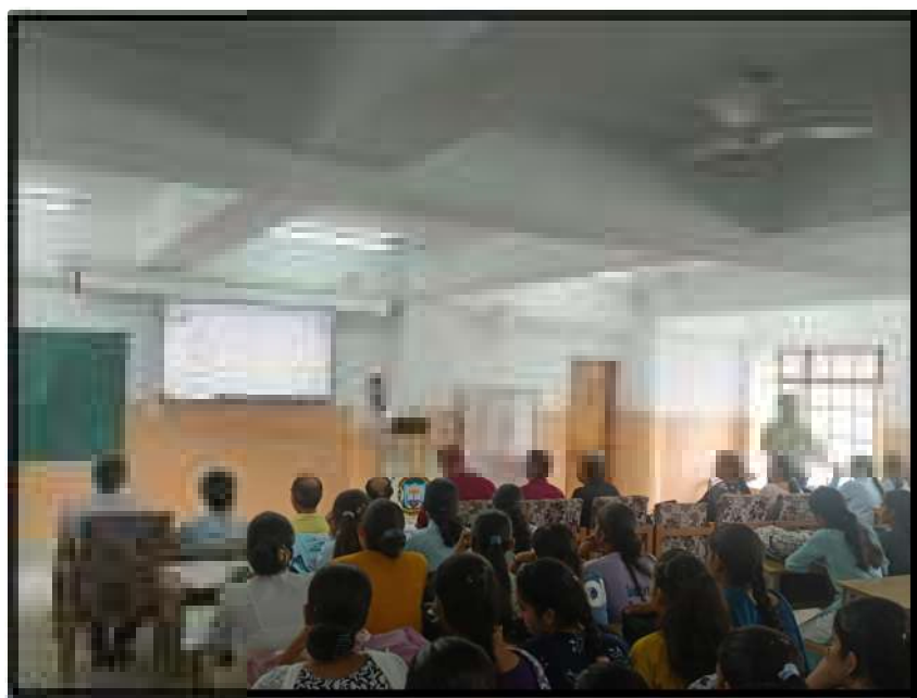
Orientation-cum-Enrollment Drive in the training program as well as in CC&PC