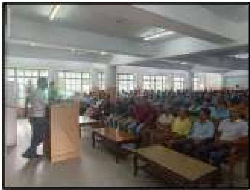
Awareness program of Skill course IOT run by HPKVN on 8 th August, 2024